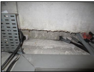
Photo N° 926 AMIANTE CIMENT -- PLACARDS TECH -1 à +4 Plafonds Plaques planes (Fibres-ciment)